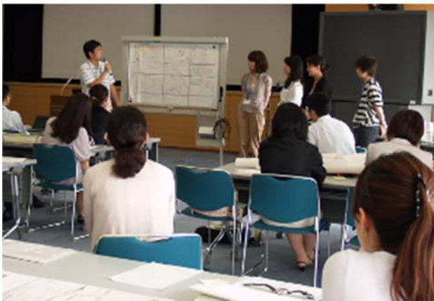
グループ発表と講評