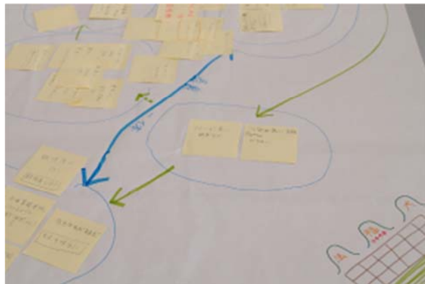
グループワーク： 付箋紙を用いたブレ インストーミング