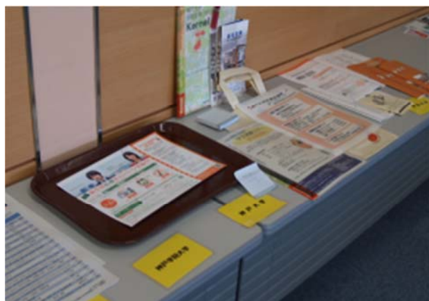
参加者の所属する図書館の 広報資料展示