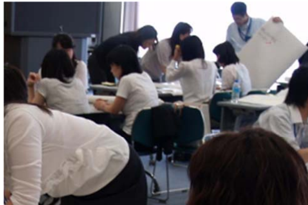
グループワーク： ディスカッション