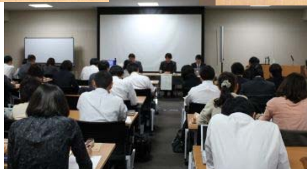
京都大学図書館機構 講演会